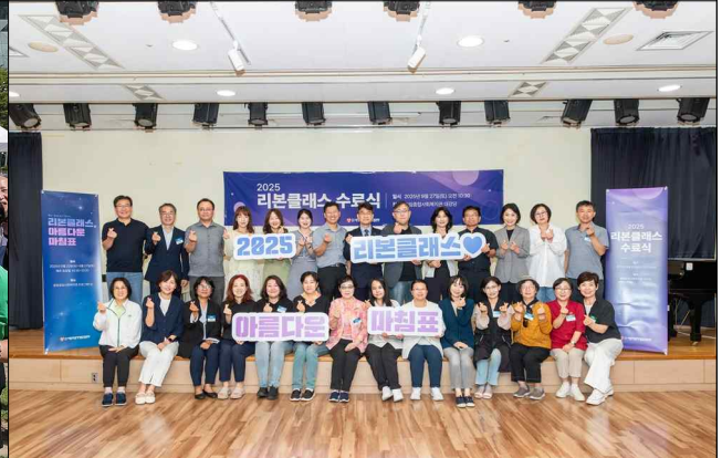
잠재 유산기부자를 위한 리본클래스(9.27)