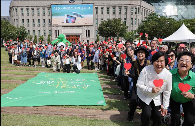
제29회 장기기증의 날(9.8)