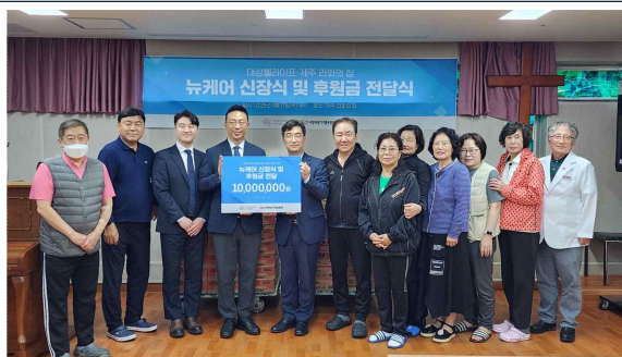
대상웰라이프 뉴케어 및 후원금 전달