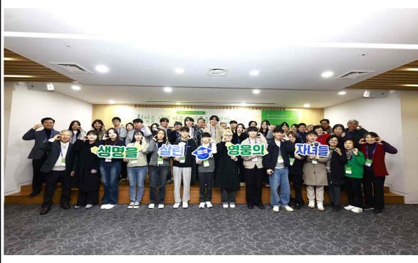
제6회 DF장학회 장학금 전달식