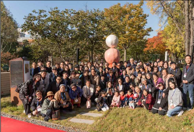
생명나눔 이름표 헌정식(11.1)