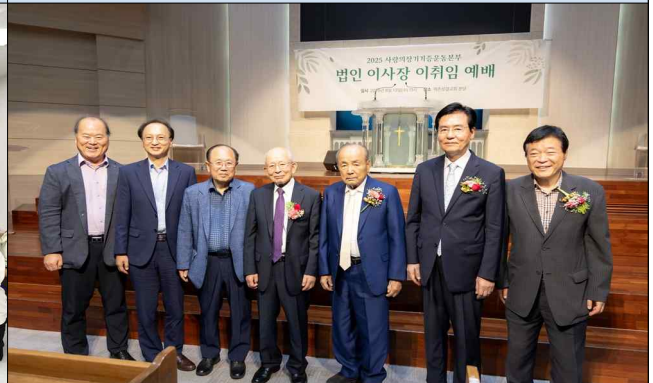
법인 이사장 이취임식(8.13)