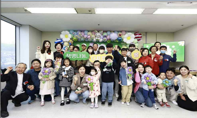
이식인 어린이 초청행사(5.1)